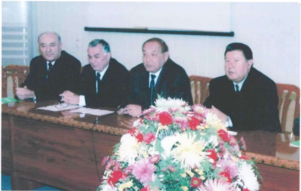
Институтни битирганимизнинг 45 йиллик тантанасидан лавҳа (2010 йил)