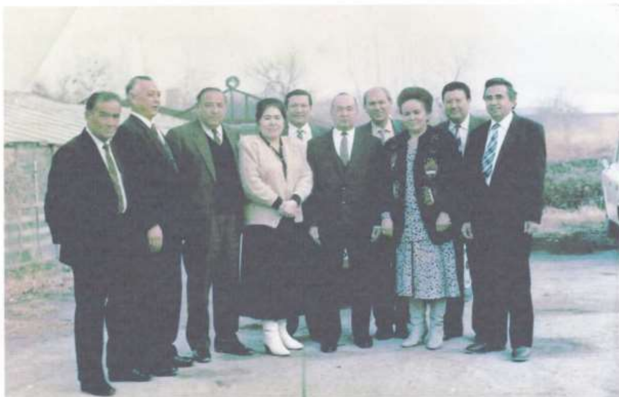
Курсдошлар даврасида (1995 й)