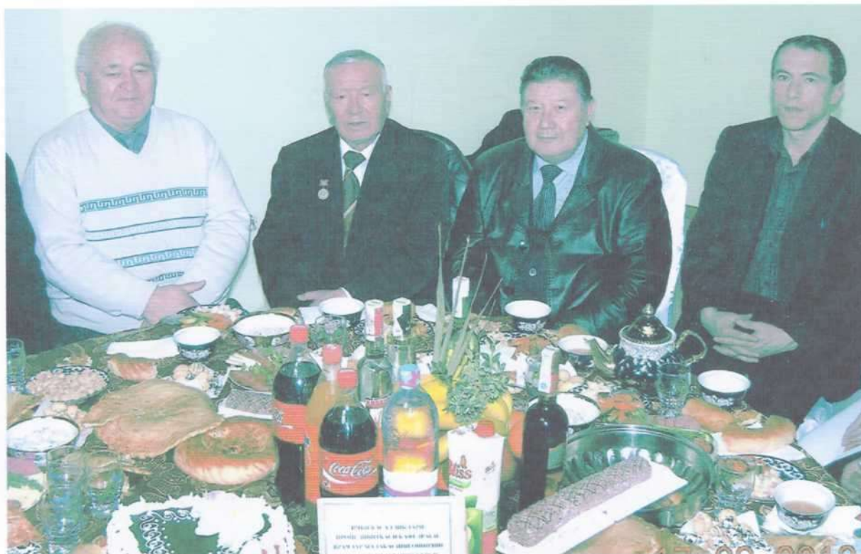
Наврўз тантанасида (2012й)