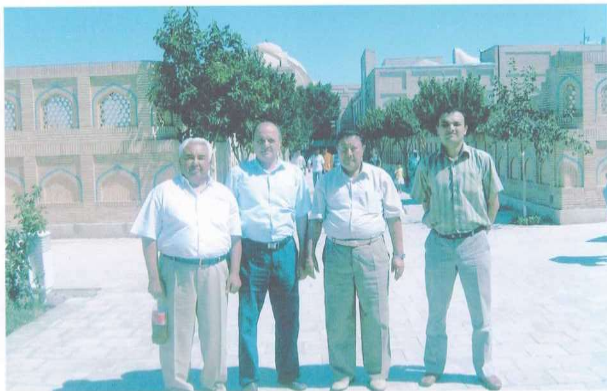
Бухорода Нақшбанд Хазратларининг зиёратгоҳида (2008 й)