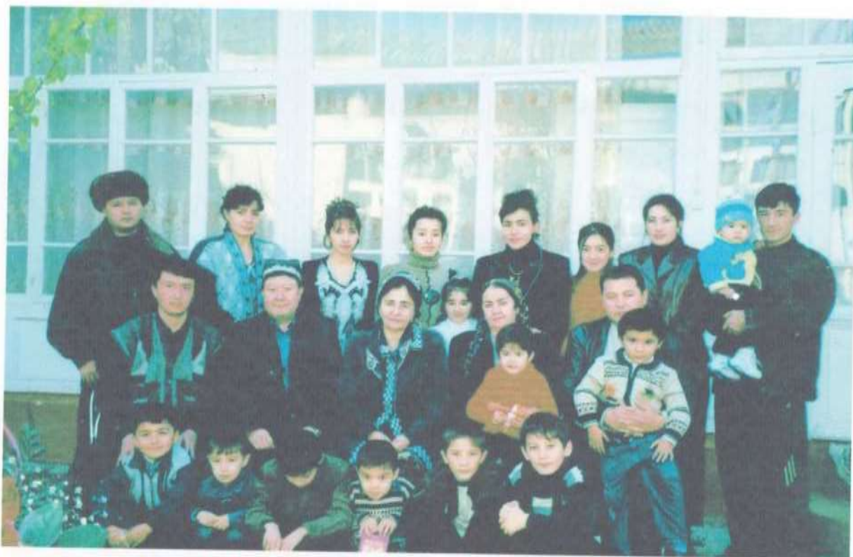
Оила аъзоларимиз даврасида