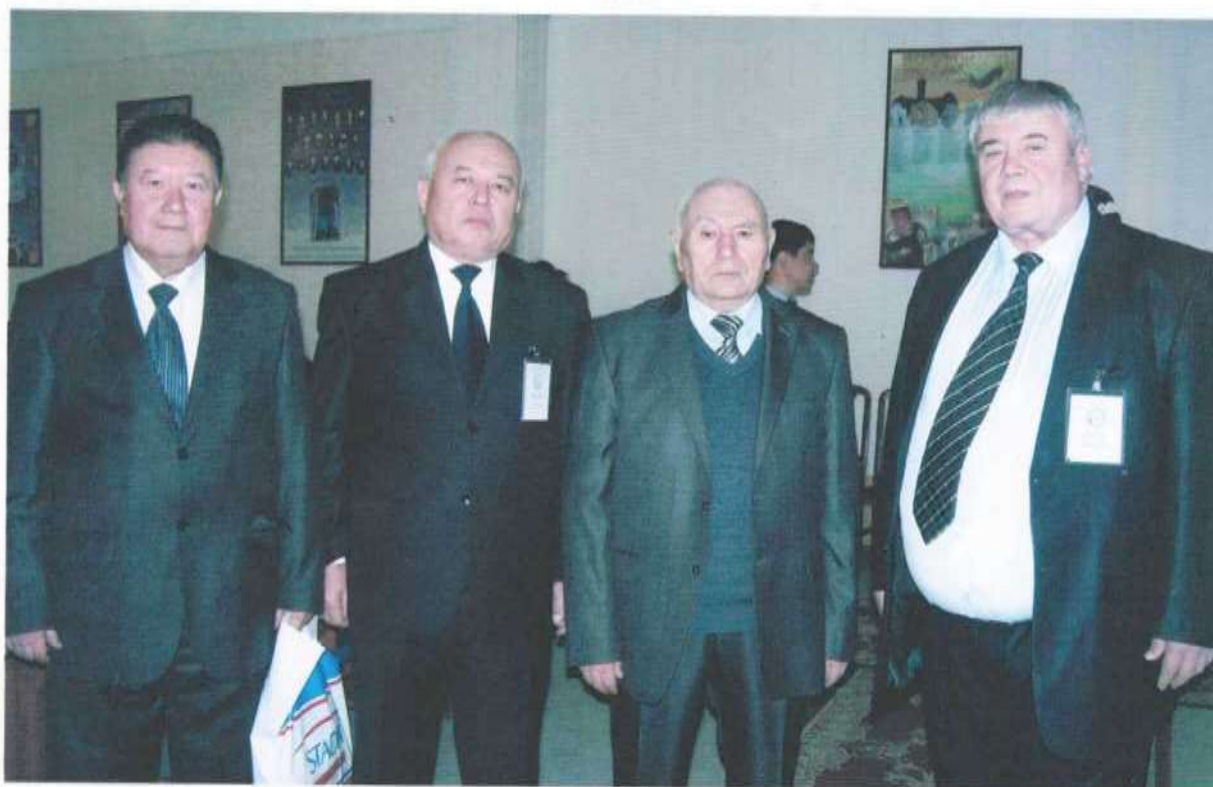
Республика миқёсидаги анжуман пайтида (2012 й)