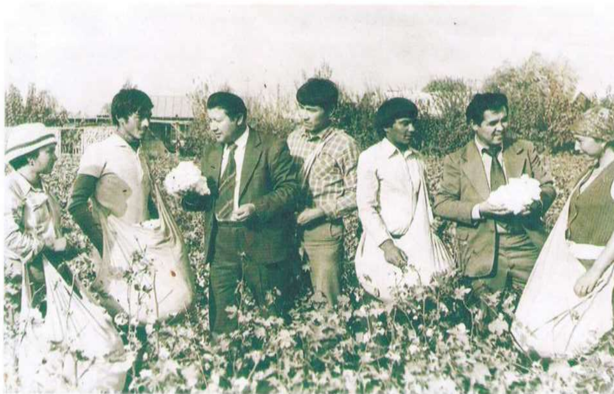
Пахта далаларида (1985 й)