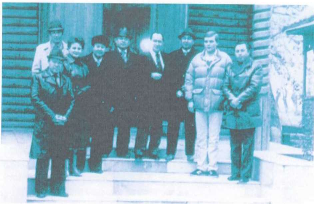
Академик И.К Шхвацабая шогирдлари даврасида (1983 й)