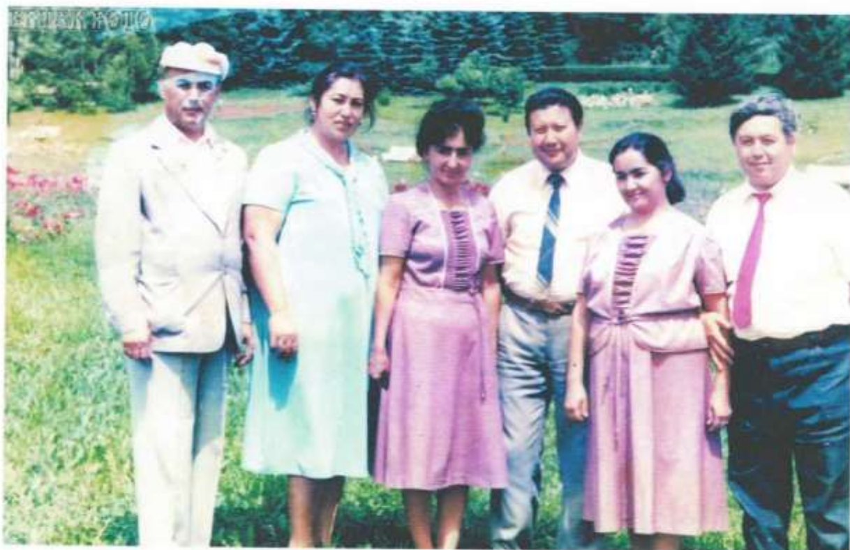
Кисловодск оромгоҳида (1985 й)