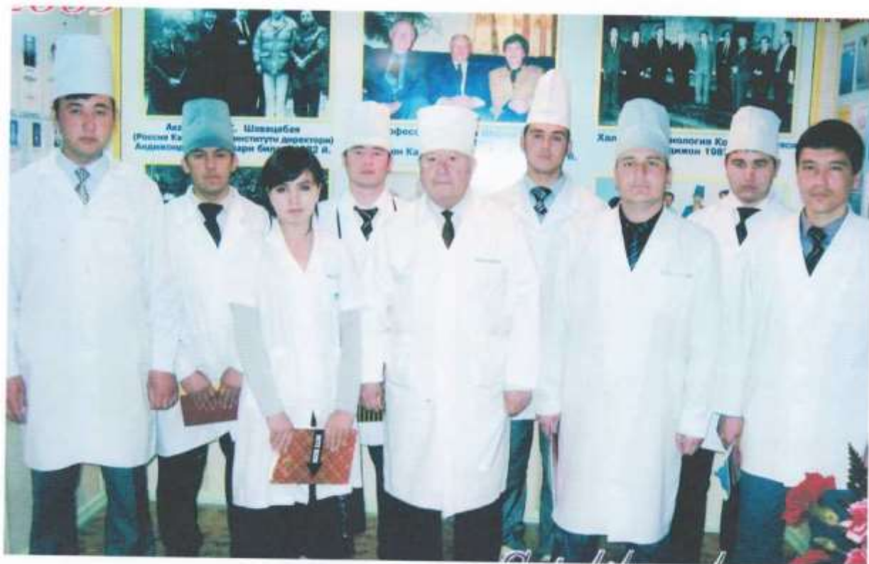
Иқтидорли талабалар даврасида (2010 й)