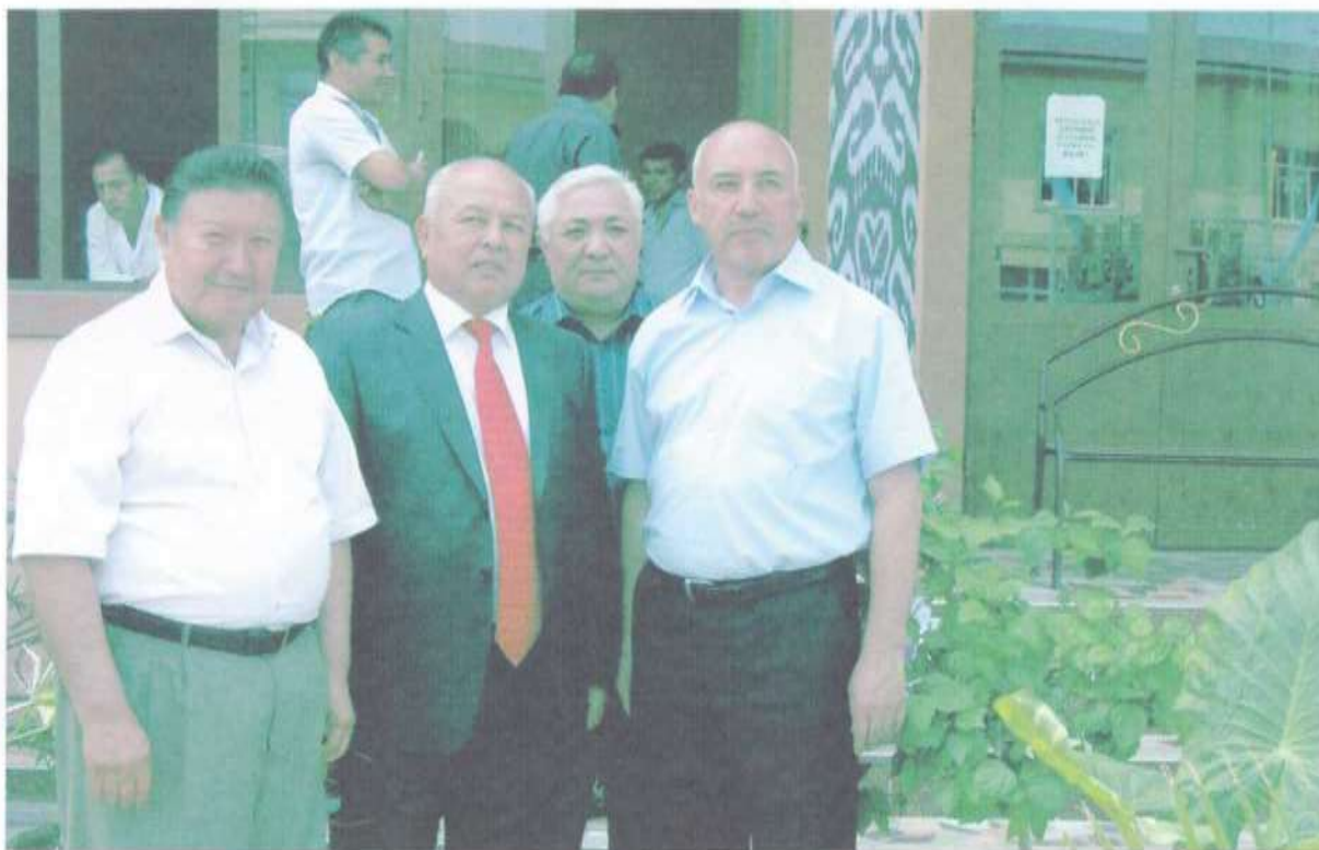
Гуллар байрамида касбдошлар даврасида (2011 й.)