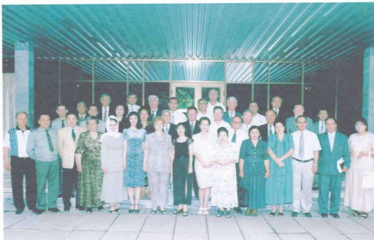
Тошкентда малака ошириш пайтида (2001 й)