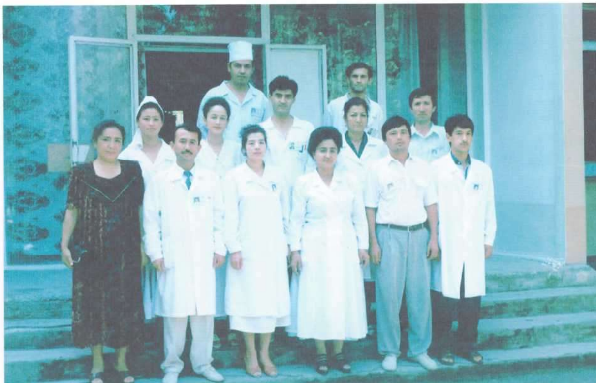
Рафиқам жамоа аъзолари билан (2010 й)