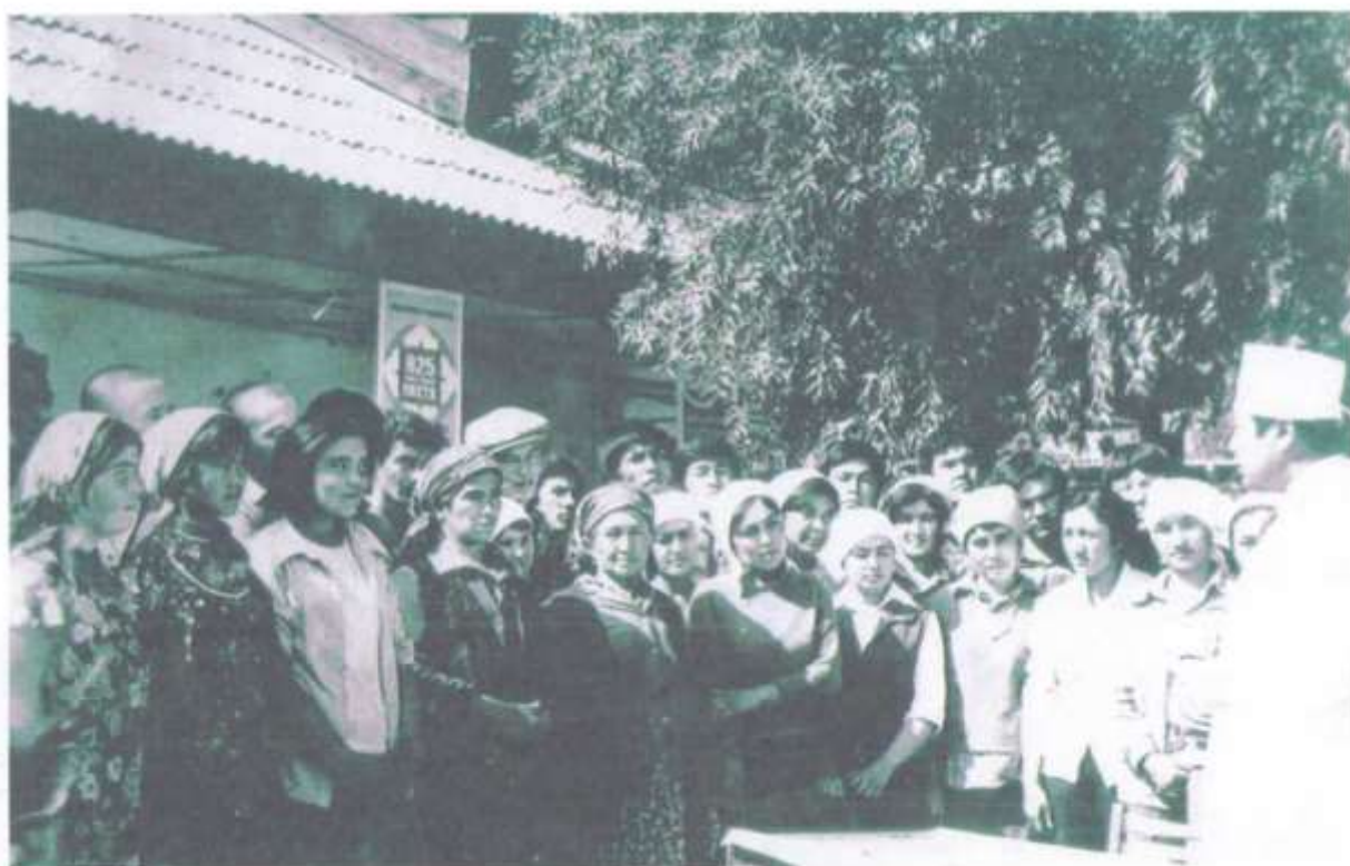
Дала шийпонидаги суҳбат (1982 й)