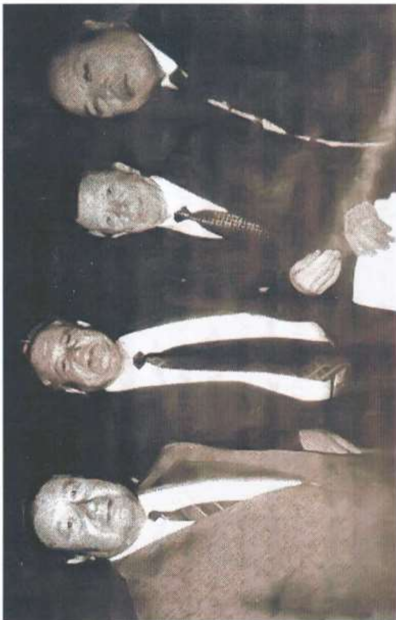
Академик И.К. Чазов шогирдлари давларида (2005 й)