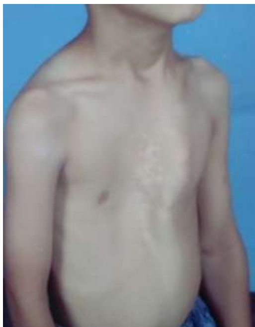
Рисунок 3. Гиперкоррекция грудины

В связи имевшихся вторичных деформаций после корригирующей торакопластики на грудной стенке, нами изучены возможные причины удовлетворительных и неудовлетворительных результатов лечения. Удовлетворительными признаны результаты у 15 детей, у которых имелось частичное западение какого-либо участка в области операции (8), гиперкоррекция грудины (3) (рис. 3), экзостозы того или иного ребра (4) (рис. 4).