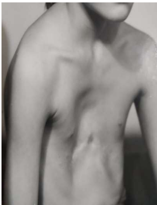
Рисунок 5. Рецидив воронкообразной деформации