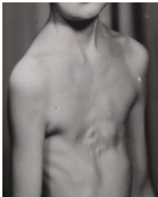
Рисунок 4. Экзостозы ребер

Неудовлетворительные результаты получены у 4 больных, оперированных по поводу врожденной воронкообразной деформации грудной клетки, в течении первого года после операции вновь появилось