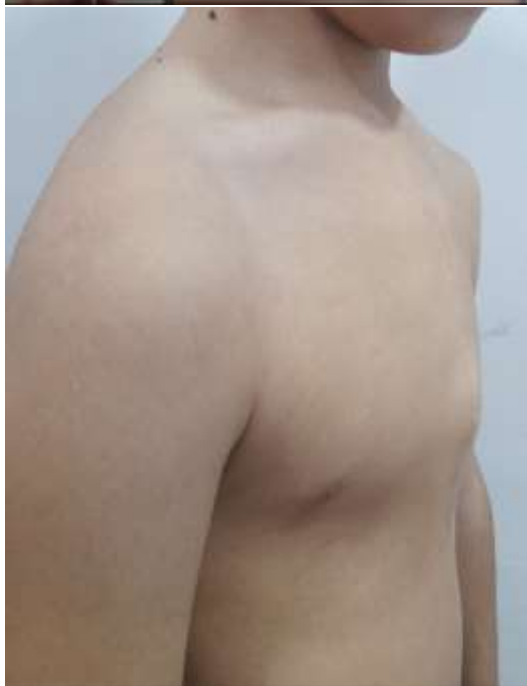
Рисунок 7. Вторичная килевидная деформация после операции на сердце